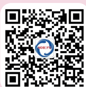
中国出生缺陷干预 救助基金会